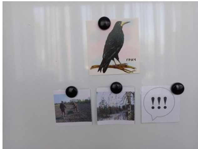
Фото 4. Мнемодорожка к загадке «Летом за пахарем ходит, а под зиму с криком уходит» (тема «Перелетные птицы»)