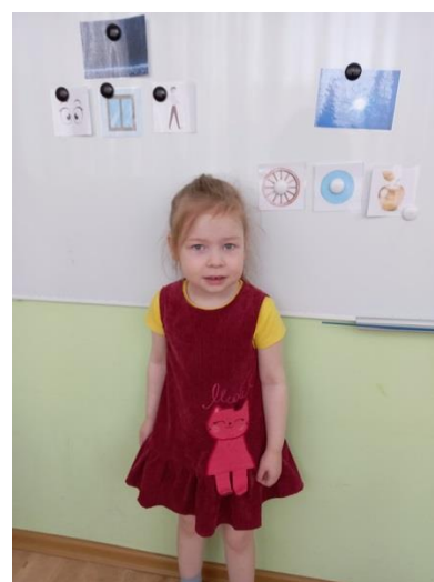
Фото 2, 3. Занятия по теме «Весна» с использованием готовых мнемоквадратов