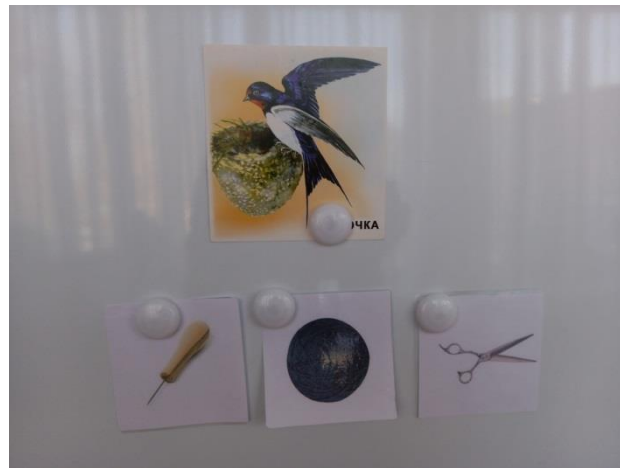
Фото 5. Шило впереди, клубок посреди, ножницы сзади (Ласточка). Мнемодорожка к загадке