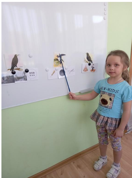
Фото 7. Занятие по теме «Перелетные птицы»