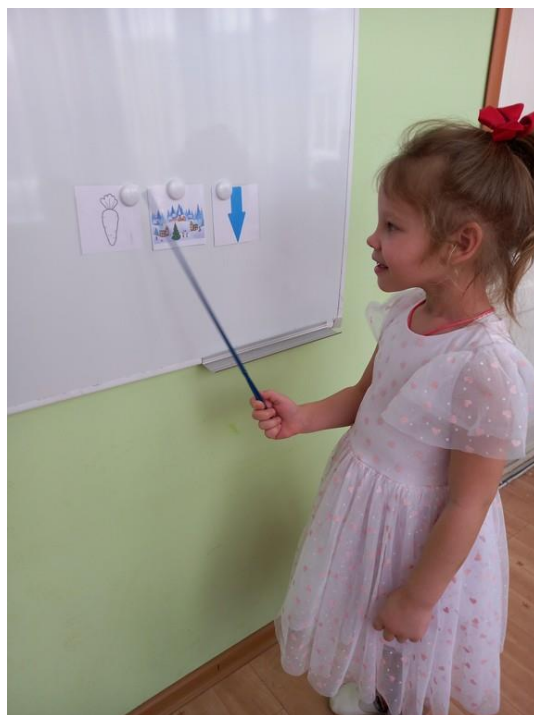
Фото 1. Использование готовых мнемоквадратов на занятии по теме «Зима»