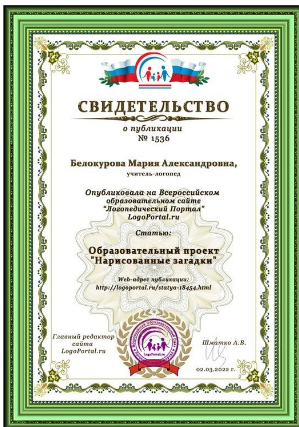
Фото 8. Представление опыта в СМИ