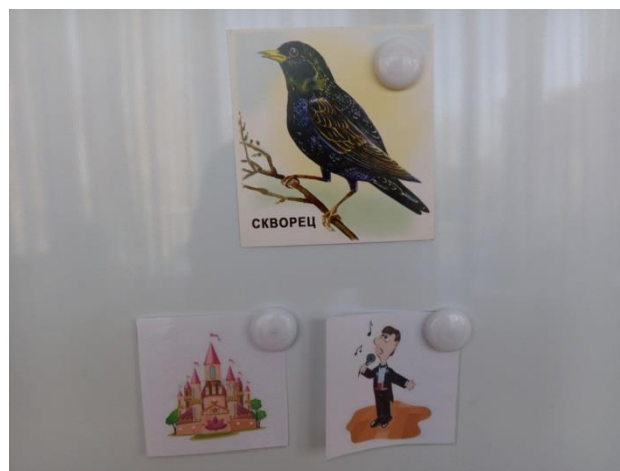
Фото 6. На шесте дворец, во дворце певец (Скворец). Мнемодорожка к загадке