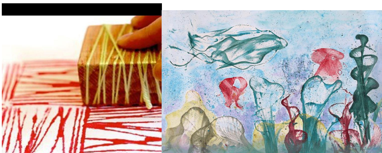
Рисунок может быть выполнен несколькими способами: путем пропитывания ниток краской и скольжению по бумаге, а так же штампами.

Интересно и доступно технику описывает следующая сказка - история: