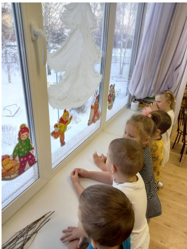
Фото 1. Дети у окна, подготовленного логопедом.