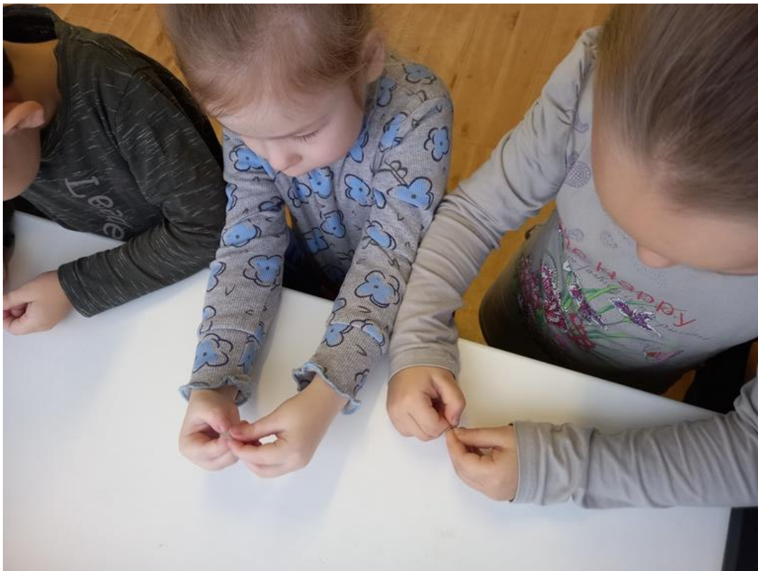
Фото 7 и 8. Самая трудная задача – справиться с маленькими наклейками...