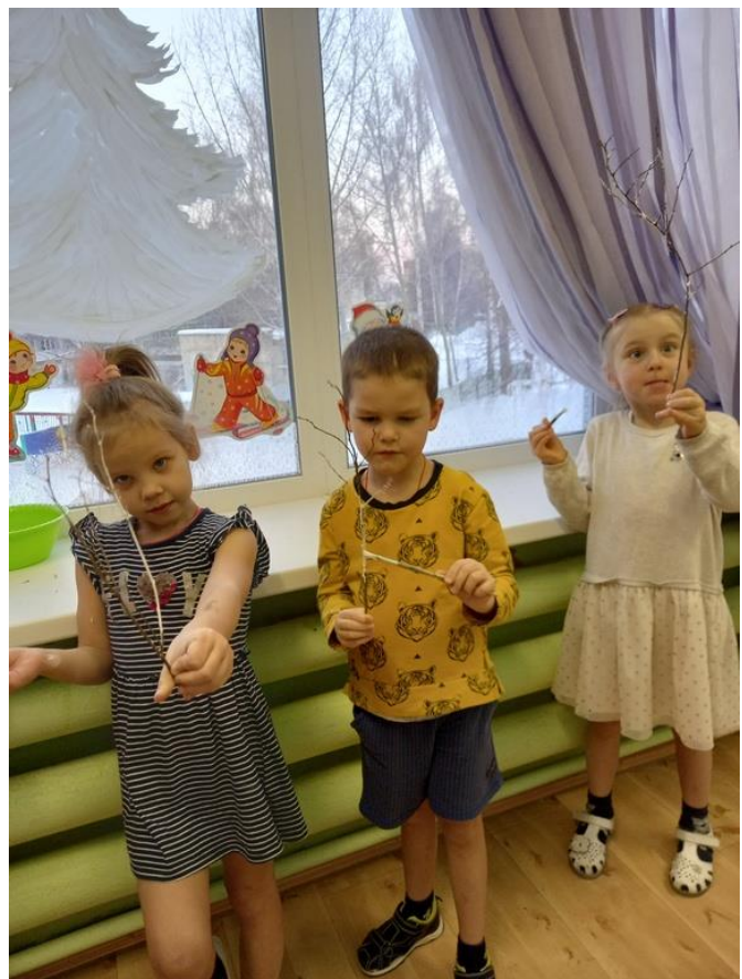
Фото 5 и 6. Кажется, всё получается!