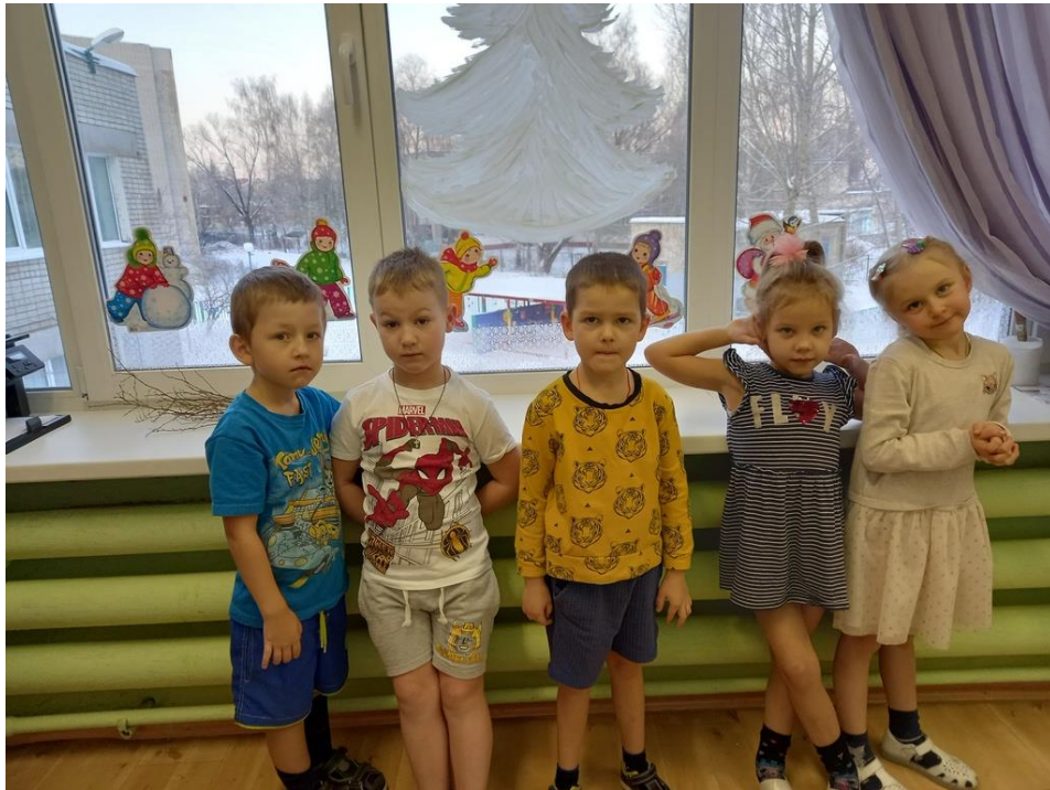
Фото 3. Готовы украшать дальше!