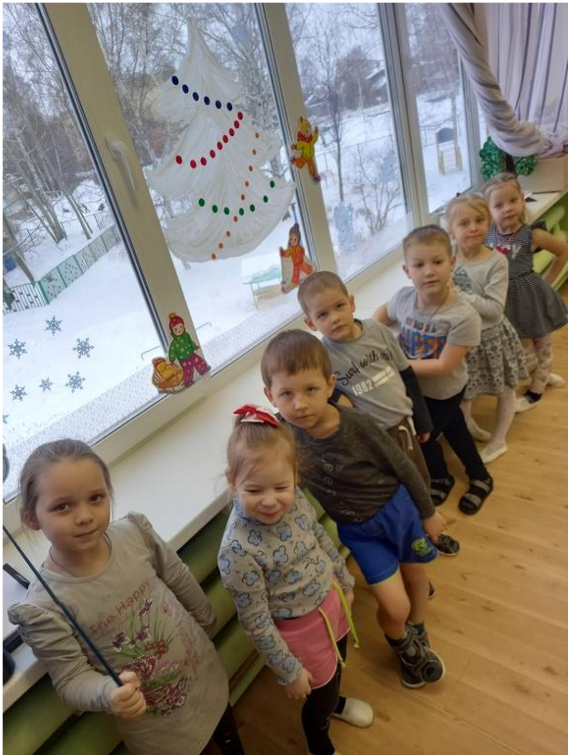
Фото 14. «Очень интересное сегодня было занятие!»