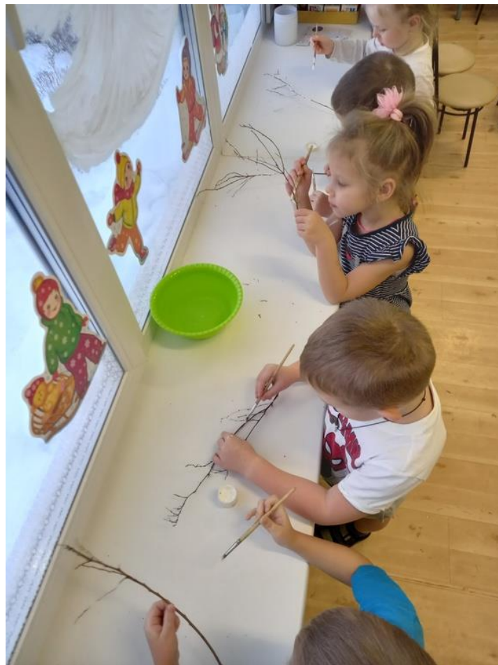
Фото 4. Дети закрашивают веточки.