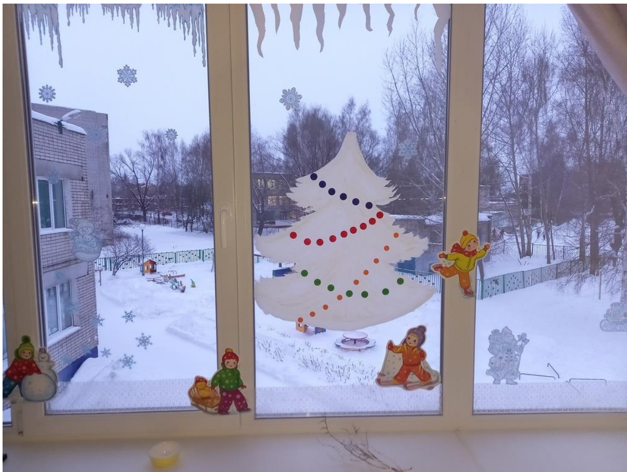
Фото 11. Результат совместной работы.