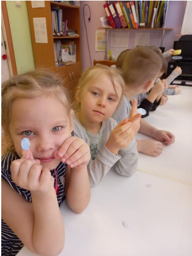
Фото 9. Наклейки готовы!