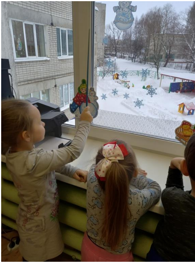
Фото 12. Можно заниматься!