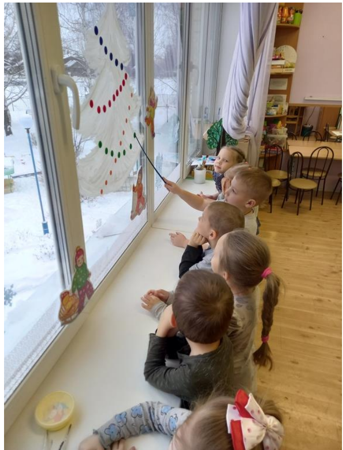
Фото 13. Помощница указка.