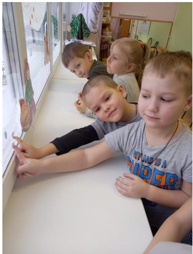
Фото 10. Клеим!