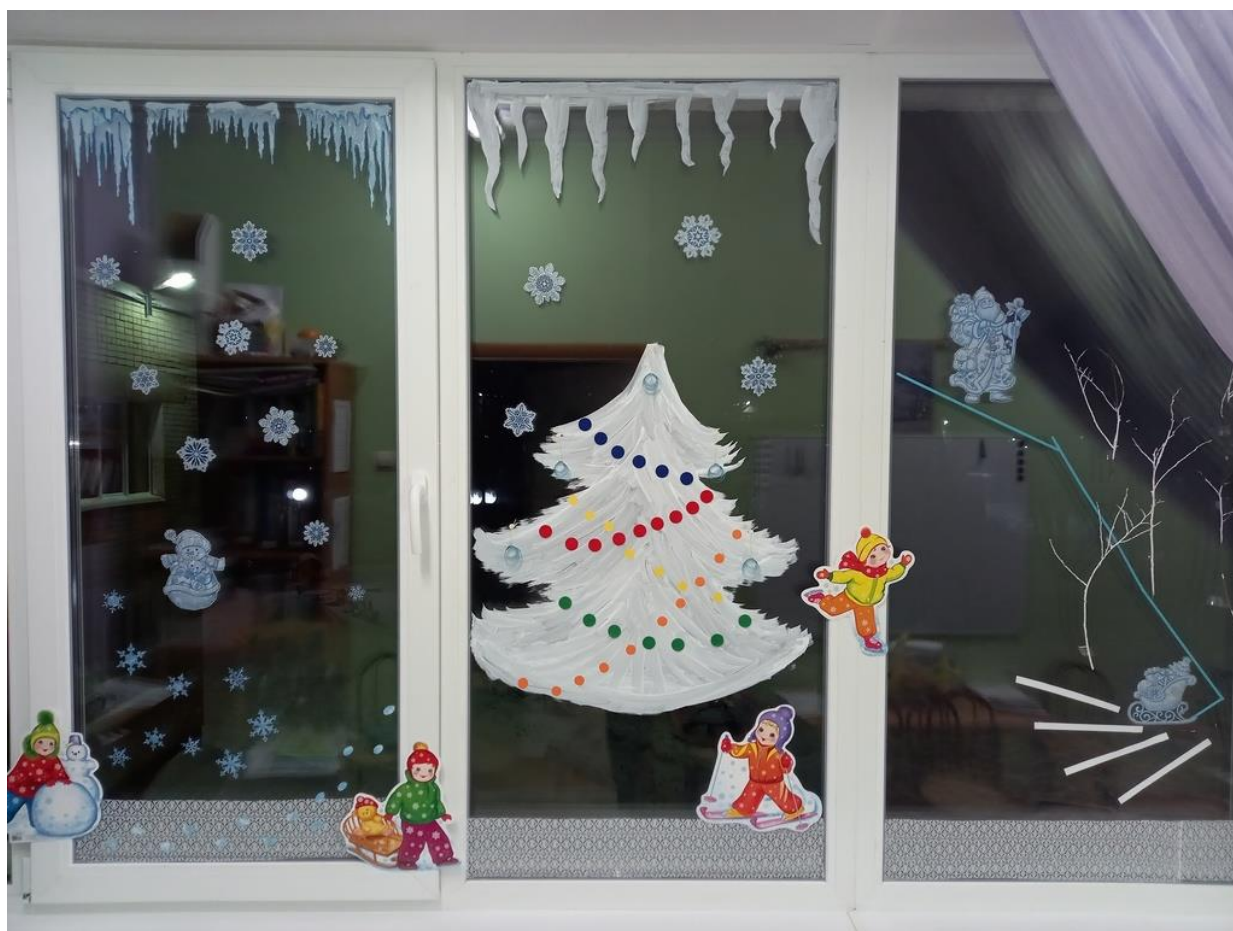
Фото 15. Логодорожки на нашем окошке.