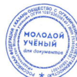
Фото 17. Справка о публикации статьи в сборнике материалов конференции.