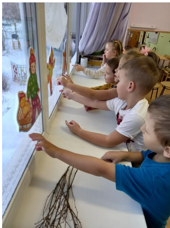
Фото 2. Дети проверяют, как далеко могут дотянуться.