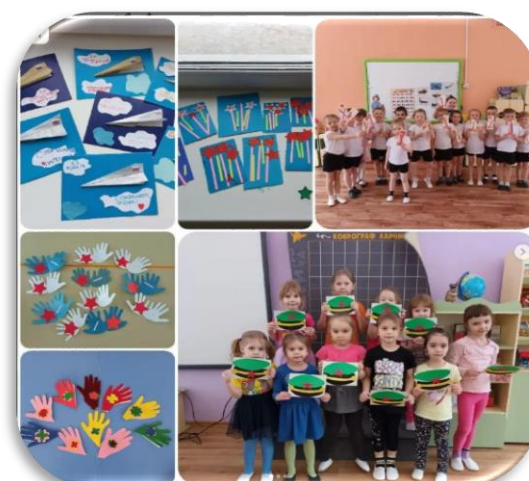
Поздравление для папа на 23 февраля