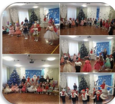
Группа № 6