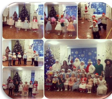
Группа № 4