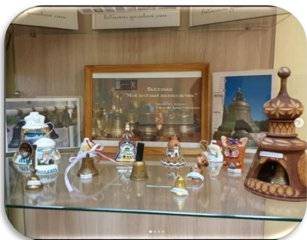
«Мой весёлый коколячок» Группа № 2