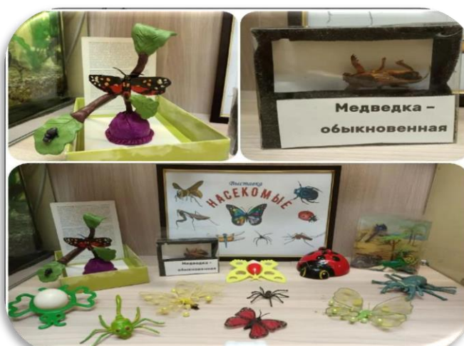
«Наши друзья – насекомые» Группа № 4