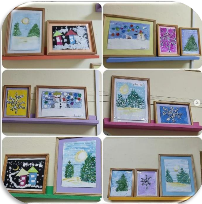
Выставка «Зимний вернисаж»