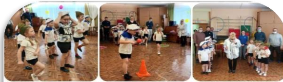
Группа № 4