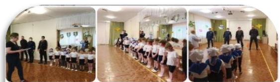
Группа № 6