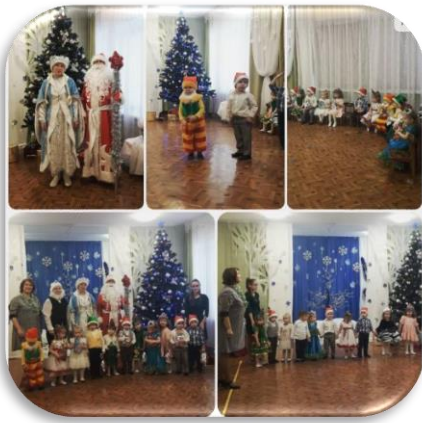
Группа № 3