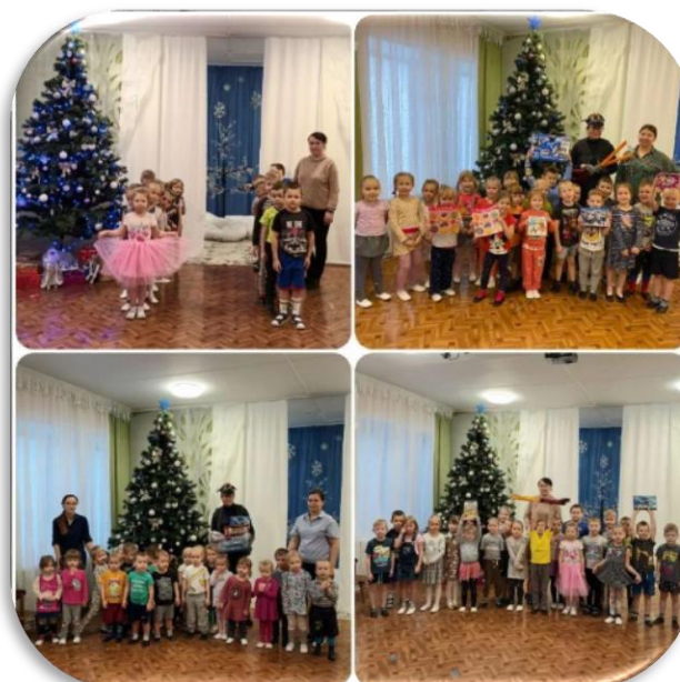
«Прощание с ёлочкой»