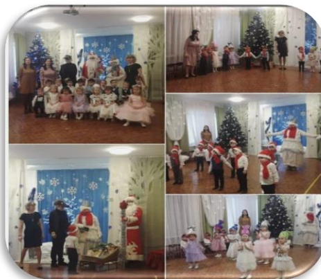
Группа № 2