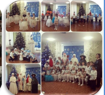
Группа № 5