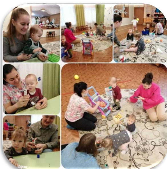
«Кукольный театр «Репка»»