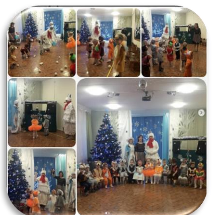
Группа № 1