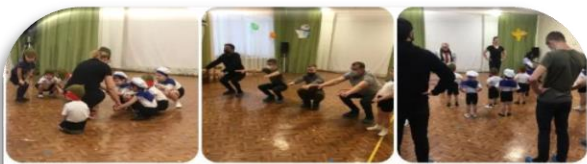
Группа № 2