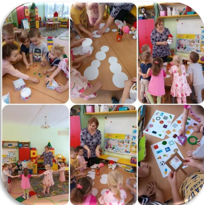
Открытое занятие в младшей группе По теме «Форма, цвет, величина»